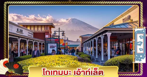
โทเทมบะ เอ้าท์เล็ต