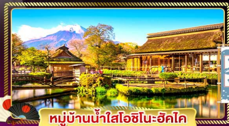
หมู่บ้านน้ำใสโอชิโนะซึกิโค