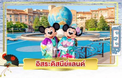
อิสระคิสนีย์แลนด์