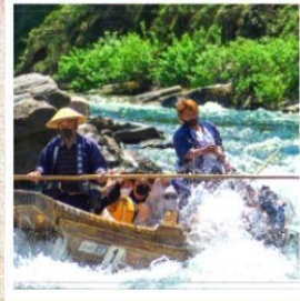
ล่องเรือหุบเขานากาโทโระ