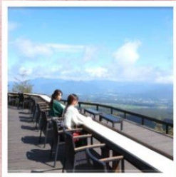
จุดชมวิวกิโยซาโตะ