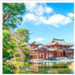
วัดเบียวโดอิน

วัดเบียวโดอิน ชม "วิหารแห่งความงามอมตะ" สัญลักษณ์ที่ถูกจารึกไว้บนเหรียญ 10 เยน. ชิราคาวาโกะ หมู่บ้านมรดกโลก บ้านกึ่งโซะสุริสวายตั้งเทพนิยาย จุดชมวิวกิโยซาโตะ ที่ราบสูงกับทิวทัศน์สุดชิล ท่ามกลางสายลม ขุนเขา และทุ่งหญ้าเปลี่ยนสี ศาลเจ้ามิตสึมิเนะ แดนศักดิ์สิทธิ์บนยอดเขา ศูนย์รวมพลังอันโด่งดังกว่า 1,900 ปี TEAMLAB PLANET ตี๋มต่ำกับโลกแห่งแสงสีไร้ขีดขอบเขต ความมหัศจรรย์เหนือจินตนาการ ล่องเรือหุบเขานากาโทโระ สัมผัสเสน่ห์เรือไม้ดั้งเดิมผ่านสายน้ำธรรมชาติและวัฒนธรรม พักออนเซ็น 1 คีน!!! // เมนุพิเศษ...บุฟเฟ่ต์ปิ้งย่าง, บุฟเฟ่ต์ชาบู กรู๊ปสบายๆ เพียง 20 ท่านเท่านั้น!!!