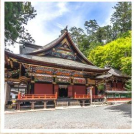
ศาลเจ้ามิตสึมิเนะ