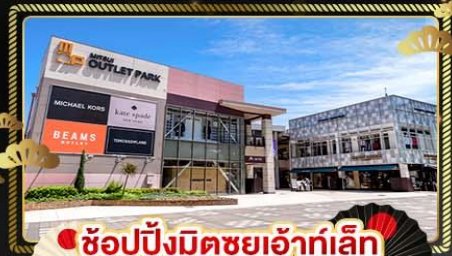
ช้อปปิ้งมิตซูฮิอาร์ทเล็ก