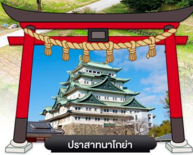
ปราสาทนาโกย่า