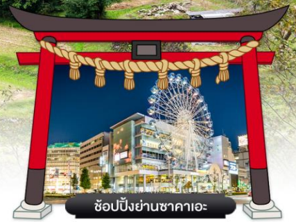
ซุปเปอร์แลนด์นาโกย่า