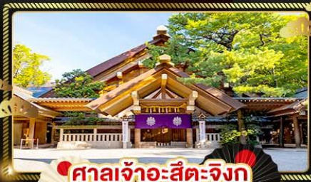
ศาลเจ้าอะสึตะจิงกุ