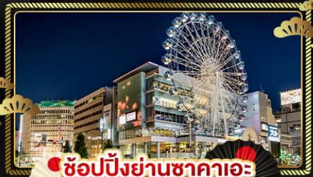
ช้อปปิ้งย่านซากาเอะ