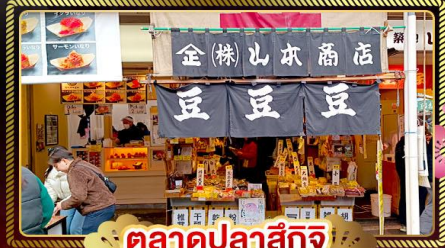
ตลาดปลาสึกิจิ