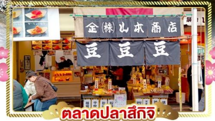
ตลาดปลาสึกิจิ