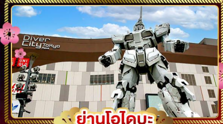
ย่านโอไดบะ