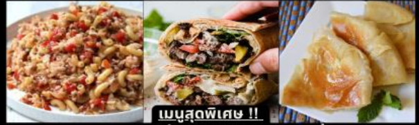
เมนูสุดพิเศษ !! KOSHARI (ข้าวคลุกถั่ว) / SHAWARMA (เนื้อห่อแป้ง) / FITEER BALADI (พืชชาอียิปต์)