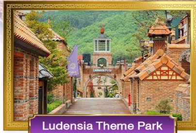
Ludensia Theme Park

• เมนูพิเศษ! ปังย่างเกาหลี, Seafood Hotpot, จิมกัก