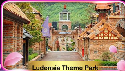
Ludensia Theme Park