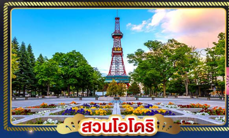
🕒 สวนโอไดริ