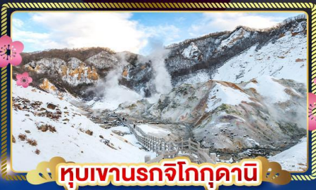
♨️ หุบเขานรกจิโถกุดานิ