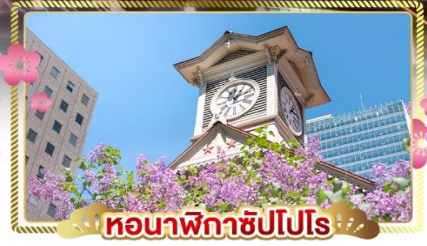
หอนาฬิกาชิบโปโร