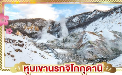
หุบเขานรกจิโกกุคานิ

✓ ชมน้ำพุร้อนธรรมชาติ ณ หุบเขานรกจิโกกุคานิ