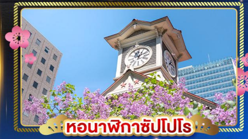
🕒 หอนาฬิกาชิปปโปโร