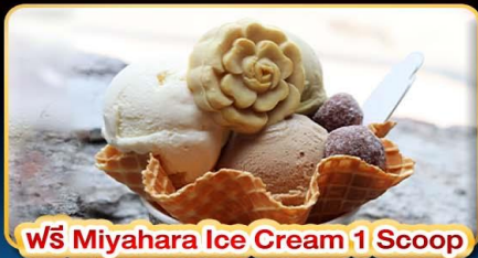
ฟรี Miyahara Ice Cream 1 Scoop

"ขอความรักวัดหลงซาน" ปล่อยคอมลอยเส้นทางรถไฟผิงซี