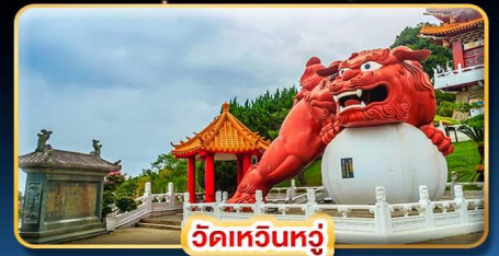
วัดเหวินทง