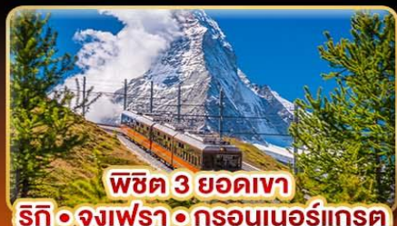
พีชิต 3 ยอดเขา ริทึ • จุงเฟรา • กรอนเนอร์แกรด