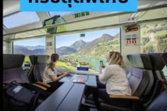
รถไฟ Panorama วิวดูวิว