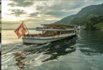
ล่องเรือชมวิวทะเลสาบลูเซิร์น