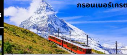
กรอนเนอร์เกรต