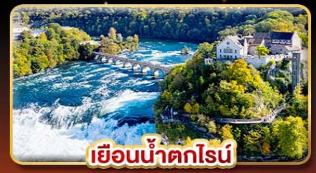
เขื่อนน้ำตกไรน์