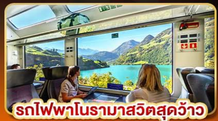
รถไฟพานoramาสวิตสุดจ้าว

📅 เดินทาง 14- 21 เม.ย. | 09-16 พ.ค. | 30-06 มิ.ย. 68