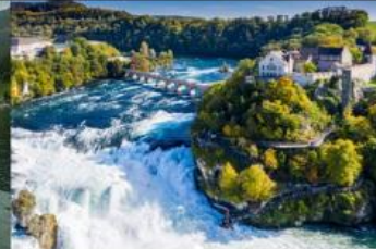
เขื่อนน้ำตกไรน์