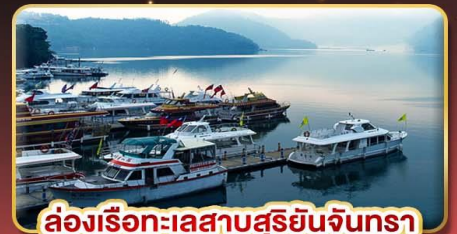
ล่องเรือทะเลสาบสุริยจันทร์