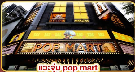
แวะจุ่ม pop mart ที่ออตที่สุดในซีเหมินติง