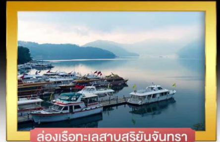
ล่องเรือทะเลสาบสุริยอันจินทรา