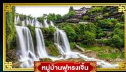
หมู่บ้านฟุหลงเจิ่น