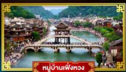
หมู่บ้านเฟิ่งทง

สุดคุ้ม!! พักหรู 5 ดาว ทุกคืน เที่ยว 2 เมืองโบราณแดนมังกร