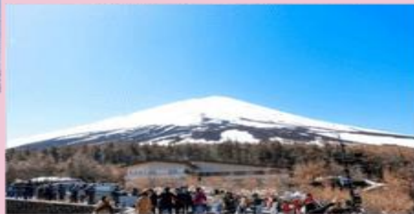
รูปถ่ายของประกอบการเดินทางทำขึ้น