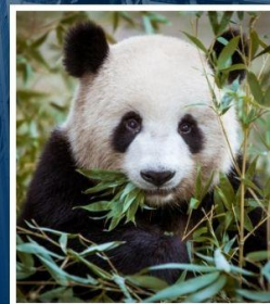
ศูนย์อนุรักษ์หมี แพนด้า