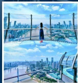
RAFFLES CITY CHONGQING