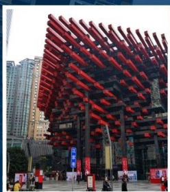
พิพิธภัณฑ์ศิลปะ ฉงชิ่ง