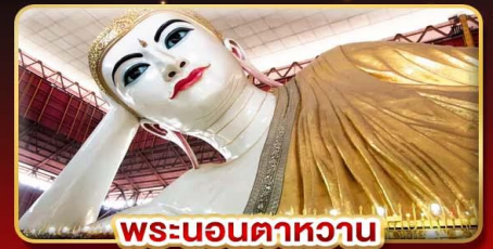
พระนอนตาหวาน