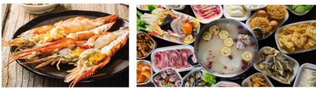
*ภาพที่ใช้เพื่อการโฆษณาเท่านั้น