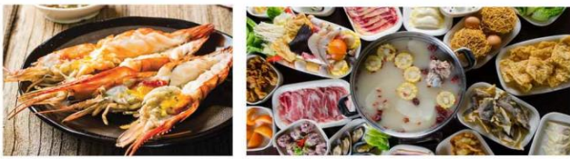
*ภาพที่ใช้เพื่อการโฆษณาเท่านั้น