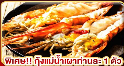
พิเศษ!! กุ้งแม่น้ำเผาทำนละ 1 ตัว

สักการะ 3 มหาบุชชาสถาน มนต์เสน่ห์แห่งเมืองย่างกุ้ง