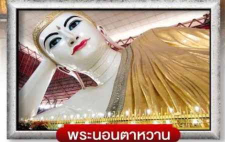
พระนอนตาหวาน

เมนู สุดพิเศษ!! กุ้งแม่น้ำเผาถ่านละ 1 ตัว ซาบูบุฟเฟ่ต์สไตล์เมียนมาร์