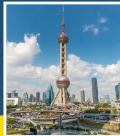
ชั้นชมหอไข่มุก