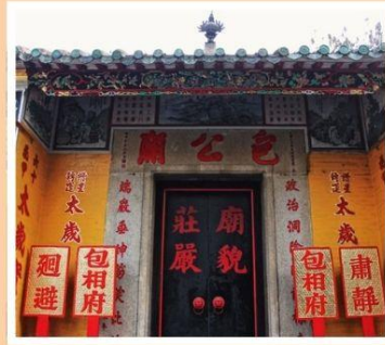
วัดเปากง