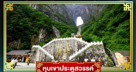
อุทยานประตูสวรรค์