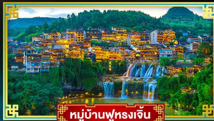
หมู่บ้านฟุทงเจิน