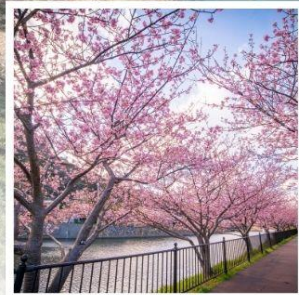
เทศกาลคาวาซุ ซากุระ