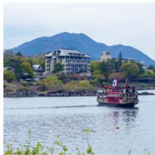
ล่องเรืออปปะระะ