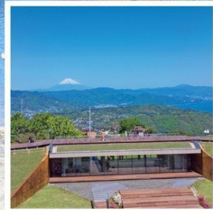
มิโระ คาเฟ่321