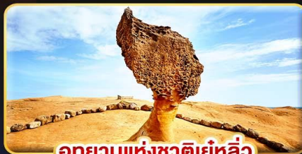
อุทยานแห่งชาติยี่หลิว