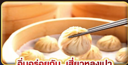
อิมอร่อยกับ..เสี่ยวหลงเปา

พิเศษ !! หม้อนึ่งจักรพรรดิ ,ไอศกรีม MIYAHARA