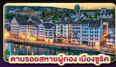
ตามรอยสหายผู้กอง เมืองซูริค