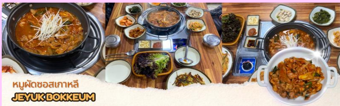
หมูผัดซอสเกาหลี JEYUKBOKKEUM

🍴 รับประทานอาหารเช้า (มื้อที่ 1) แจกบู๊บกิม หรือหมูผัดซอสเกาหลี เป็นอาหารที่คนเกาหลีนิยมทานพอๆ กับเมนูยอดฮิตอย่างบูลโกกิ รสชาติเผ็ดนิดๆหวานหน้อยๆ รับประทานคู่กับข้าวสวยร้อนๆ หรือวางหมulgบนผักสด พร้อมด้วยเครื่องเคียงต่างๆ หรือสามารถห่อเป็นคำรับประทานได้ตามใจชอบ