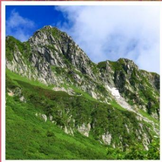
กระเช้าลอยฟ้าโคมาคะทาเกะ