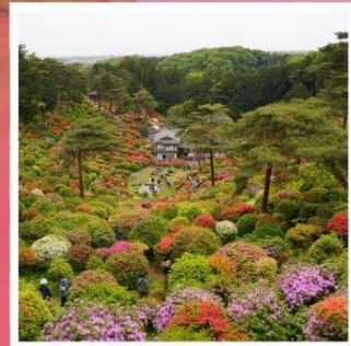
วัดชิโอะฟูเนะ คันนงจิ

โตเกียวดิสนีย์แลนด์ ดินแดนในฝันของคนทั้งโลก ฮานาโมโมะ โนะ ซาโตะ ดอกท้อกลางหุบเขาที่รอคุณมาเยือน ทางรถไฟสายเก่า เคอะเคะ อินโคลน์ 1 ในจุดชมซากุระที่สวยงามที่สุดแห่งเกียวโต ปราสาทอนูยามะ 1 ใน 12 ปราสาทดั้งเดิมกับทิวทัศน์อันแสนสวยงาม ขึ้นกระเช้าที่สูงที่สุดในญี่ปุ่น โคมากะทาเคะ กับแอ่งเทือกเขาสุดอัศจรรย์เช่นโจจิเกิ เซอร์ก ชิโอะฟูเนะ คันนงจิ วัดแห่งดอกไม้สุด unseen ที่ไม่ควรพลาด พักออนเซ็น 2 คับ!!! // อาหารพิเศษ...บุฟเฟ่ต์บิงย่าง, บุฟเฟ่ต์ซาบู, บุฟเฟ่ต์ซาปู กรุ๊ปสบายๆ เพียง 20 ท่านเท่านั้น!!!