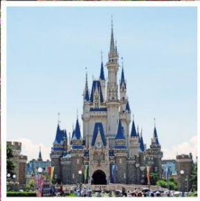
โตเกียว ดิสนีย์แลนด์ สวนฮานาโมโมะ โนะ ซาโตะ