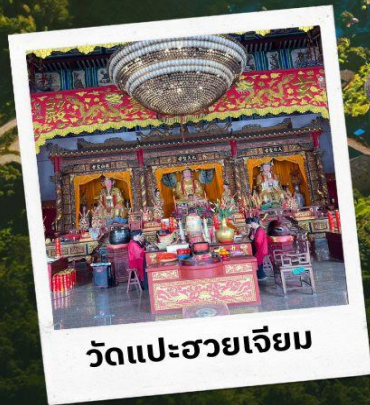
วัดแปะฮวยเจียม