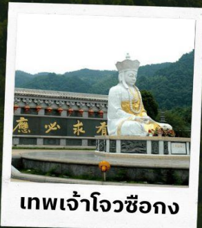
เทพเจ้าโจวซือกง