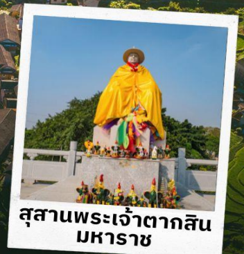
สุสานพระเจ้าตากสิน มหาราช