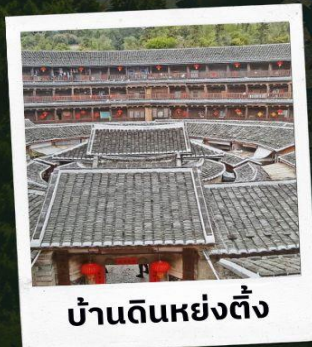
บ้านดินหย่งตั้ง