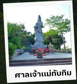
ศาลเจ้าแม่ทับทิม