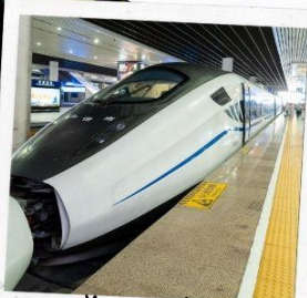
รถไฟความเร็วสูง สู่จี้จ้ายโกว