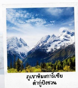
ภูเขาหิมะการ์เซีย ต่ากู่ปิงชวน