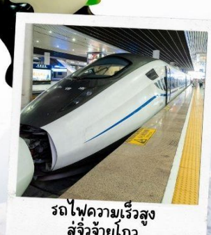
รถไฟความเร็วสูง สู่จี้จ้ายโกว