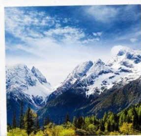
ภูเขาหิมะการ์เซีย ต้ากู่ปิงชว่น