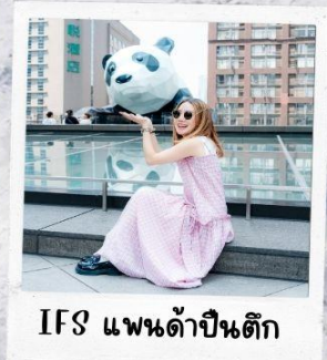
IFS แพนด้าปีนตึก