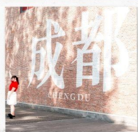
CHENGDU EASTERN MEMORY