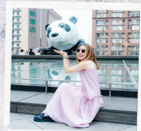
IFS แพนด้าปิงตึก