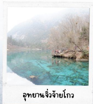
อุทยานจี้จ้ายโกว