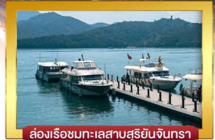
ล่องเรือชมทะเลสาบสุริยันจันทรา