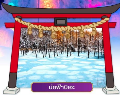
บ่อน้ำบิเอะ