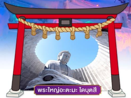
พระใหญ่อะตะมะ ไคบุตสึ