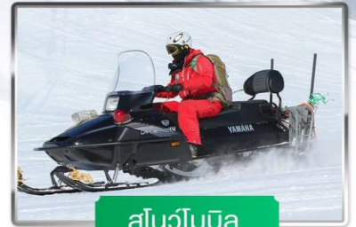
สโนว์โมบิล