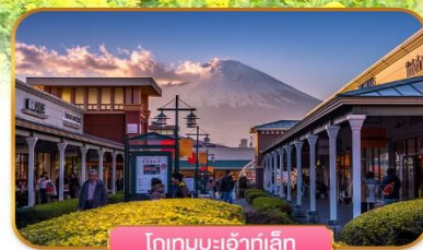
โกเทมบะเจ้าท์เล็ก