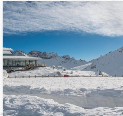
ภูเขาหิมะการ์เซียต้ากู่ปิงชวน