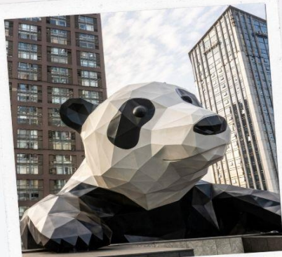
ถนนชุนซีลู่