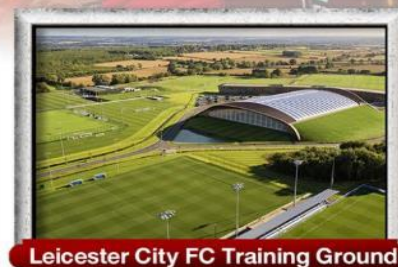
Leicester City FC Training Ground

พิเศษ!! เมนู เบอร์กอร์ตันคำรับ & กุ้งล็อบสเตอร์ และ เปิดย่างไฟร์ชี่ชั่น