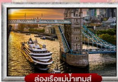
ล่องเรือแม่น้ำเทมส์