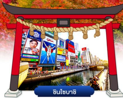
ชินโซบาชิ