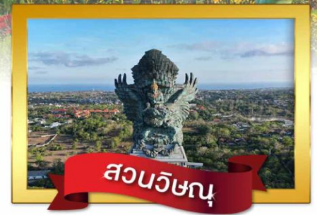
สวนวิษณุ