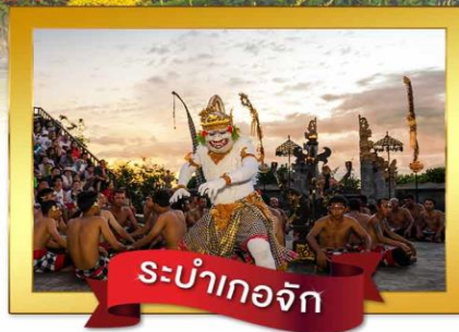
ระบำเกอจัก