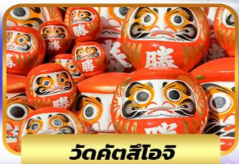
วัดคัตสึโงจิ