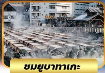
ชมยุบาคาเอะ