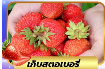
เก็บสตอเบอร์รี่