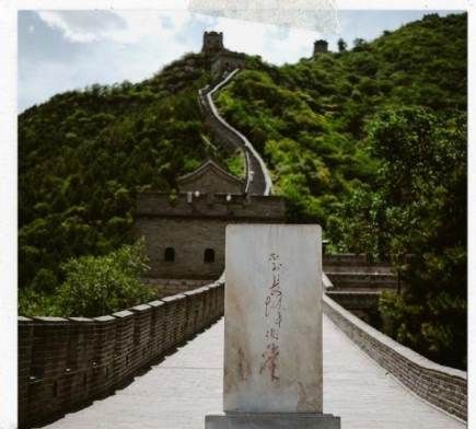
กำแพงเมืองจีน ด่านวิหยงกวน