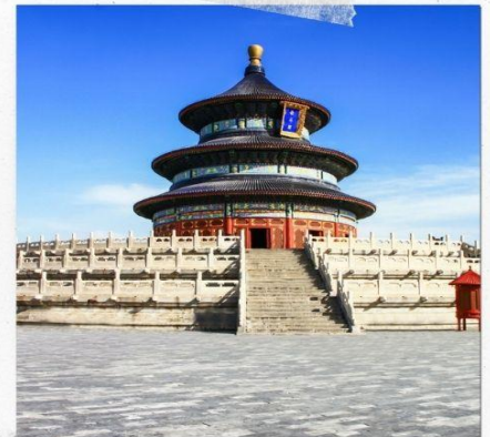
หอบูชาเทียนถาน