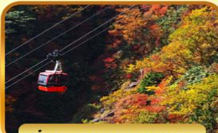
นั่งกระเช้าภูเขาโทไซไซ