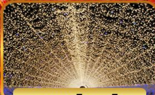
แถบะนะโอะซาโตะ

โอบาระ(ซากุระ) เมืองเกียวโต วัดคิโยมิสึ(วัดน้ำใส) หมู่บ้านชิราคาวาโกะ ถนนซันมาชิซูจิ สะพานนาคามิชิ ซ็อบบิง ซินโซบาชิ ย่านซาคาเอะ อีออน