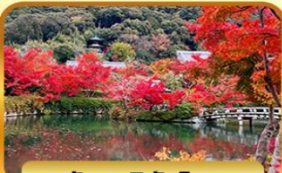
วัดเออิทังโด