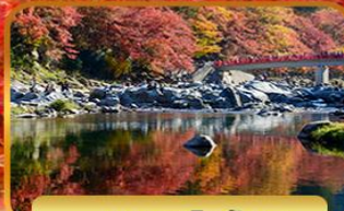
หุบเขาโคริงเค