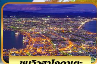
ชมวิวดาฮอกไกโด