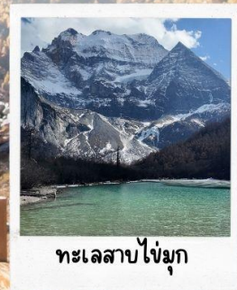
ทะเลสาบไข่มุก