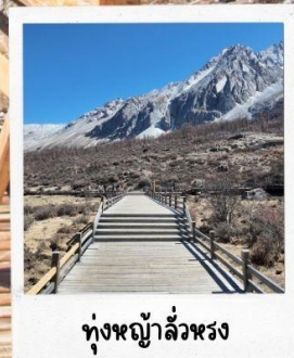
ทุ่งหญ้าลี่หวง