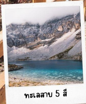
ทะเลสาบ 5 สี