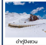
ต้ากู่ปิงชว่น