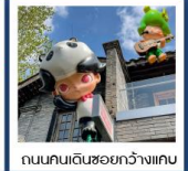
ถนนคนเดินชอยกว้างแคบ