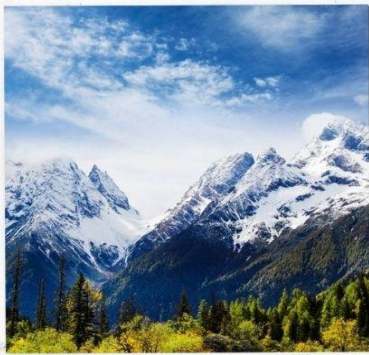
ภูเขาสี่ดรุณี