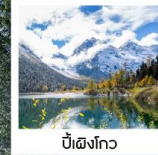
ปี้ผิงโกว

อุทยานภูเขาซีดรุณี / หุบเขาซวงเจียวโกว / อุทยานภูเขาซีดรุณี อุทยานปี้ผิงโกว / ภูเขาหิมะการ์เซียต้ากู่ปิงชว่น / วัดต้าฉือ ถนนคนเดินซุนซีลู่ / ชมแสงสียามค่ำที่ลานห้างสรรพสินค้า SKP ถนนคนเดินชอยกว้างแคบ / POP MART