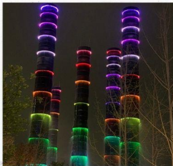
ชมแสงสีห้าง SKP