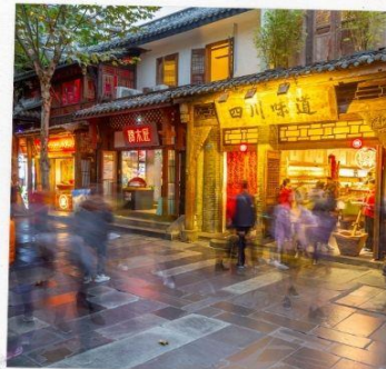
ถนนชอยกว้างแคบ