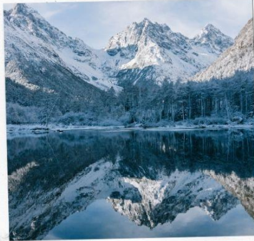
อุทยานปีเพิงโกว