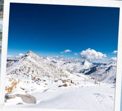
ภูเขาหิมะการ์เซีย ตำกู่ปิงชวน