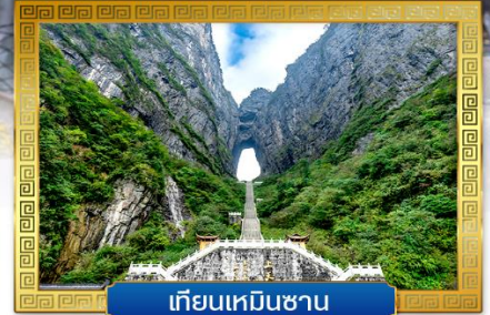
เทียนเหมินซาน