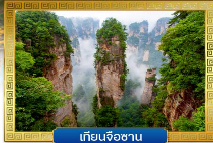
เทียนจื่อซาน