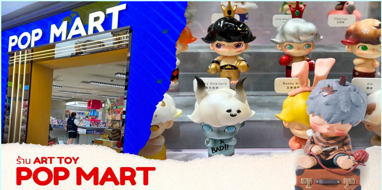
ร้าน ART TOY POP MART

นำท่านเที่ยว ถนนโบราณจินหลี่ (Jinli Ancient Street) เป็นถนนโบราณที่มีสินค้าให้เราช้อปปิ้ง ได้ทั้งของกิน และของฝากของที่ระลึก เช่น หน้ากากเจิ้งตู เพราะถนนจินหลี่นี่เป็นที่ตั้งของสถานที่แสดงโชว์เปลี่ยนหน้ากากอันโด่งดังของเมืองเจิ้งตู แค่ประตูทางเข้าก็สามารถทำให้เราเห็นถึงบรรยากาศแห่งนี้ เหมือนเดินในหนังจีนสมัยก่อนได้เลย หลังจากนั้นช้อปปิ้งต่อที่ ถนนคนเดินซุนซีลู่ สยามสแคว์เมืองเจิ้งตูเป็นแหล่งช้อปปิ้งมีร้านค้ามากกว่า 700 แห่งภายในนี้ เป็นแหล่งสถานบันเทิง และไลฟ์สไตล์ยอดนิยมใจกลางเมืองเจิ้งตู มณฑลเสฉวน มีบรรยากาศที่ทันสมัย แหล่งรวมแบรนด์ระดับโลก ร้านอาหาร คาเฟ่ บาร์ โรงภาพยนตร์ และพื้นที่จัดกิจกรรมต่างๆ มากมาย เหมาะสำหรับการเล่น ช้อปปิ้ง ทานอาหาร ดื่มด่ำกับบรรยากาศ และสัมผัสวัฒนธรรมท้องถิ่น อิสระให้ท่านช้อปปิ้ง ถนนคนเดินซุนซีลู่ มีสินค้าต่างๆ มากมาย ทั้งแบรนด์ต่างประเทศ และในประเทศ อาทิ เสื้อผ้า, รองเท้า, เครื่องหนัง, กระเป๋าเดินทาง, นาฬิกา, เกมส์, ของที่ระลึกต่างๆ ฯลฯ ตามอัธยาศัย และยังได้ช้อปปิ้ง ช้อปป POP MART อีกด้วย