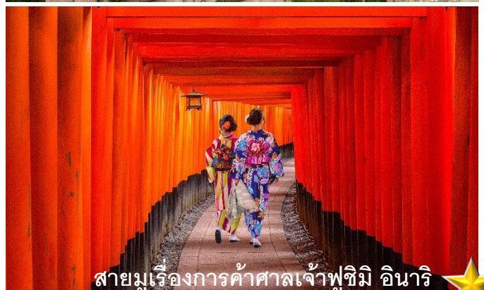
สายมูเรื่องการค้าศาลเจ้าฟูชิมิ อินาริ