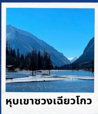
หุบเขาซวงเจียวโกว