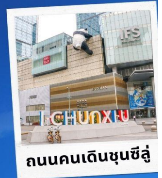
ถนนคนเดินชุนซีลู่