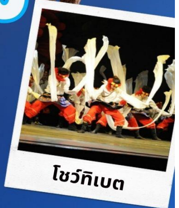
โชว์ทิเบต