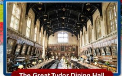
The Great Tudor Dining Hall

พิเศษ!! เมนูเบอร์เกอร์ต้อนรับ & กุ้งล็อบสเตอร์ และ เปิดย่างไฟร์ชิลล์