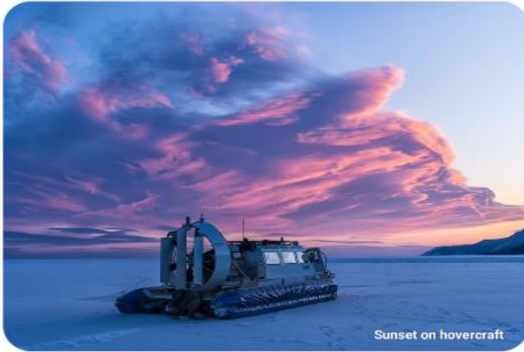
Sunset on hovercraft