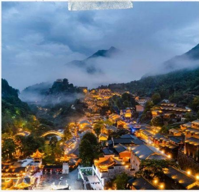
หุบเขาวังเซียนกู่