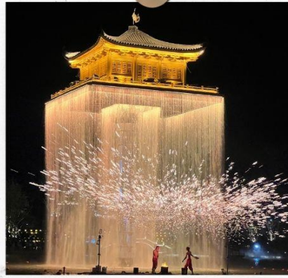
แสงไฟอุโมงค์โจว