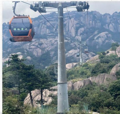
เขาลิงซาน