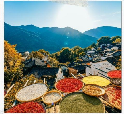
หมู่บ้านหวงลิ่ง