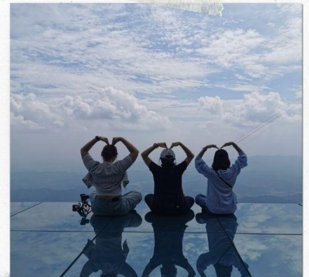
กระจกแห่งท้องฟ้า