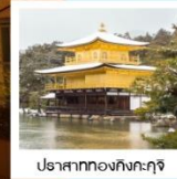
ปราสาททองหังกะกุจิ