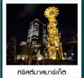
ถึสต์นาคามาจิเก็ด