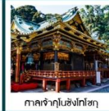
ศาลเจ้าคุโนซังโทโซกุ